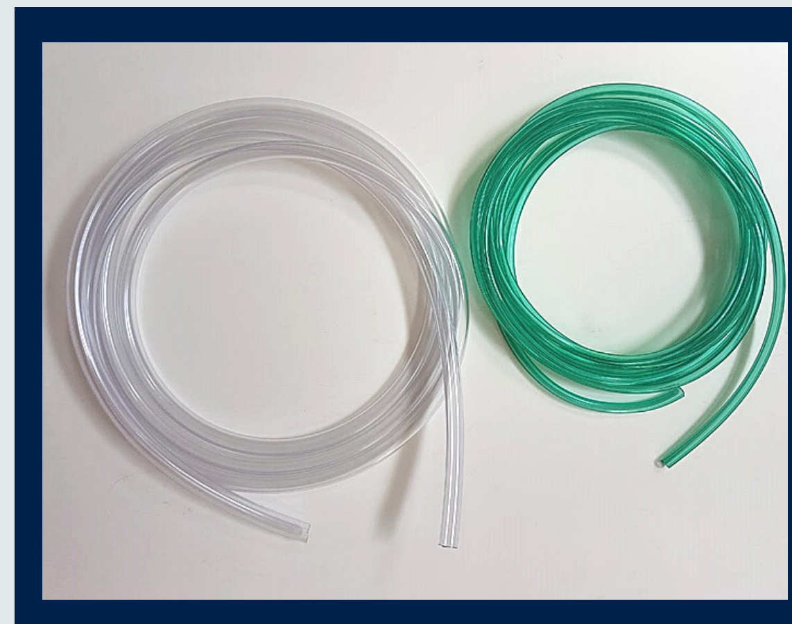
Extensão Hospitalar Clinmed (PVC Fosco para Aspiração sem Conector)

Tamanhos: (m): 1,00 - 1,50 - 2,00 3,00 (outras dimensões sob consulta)